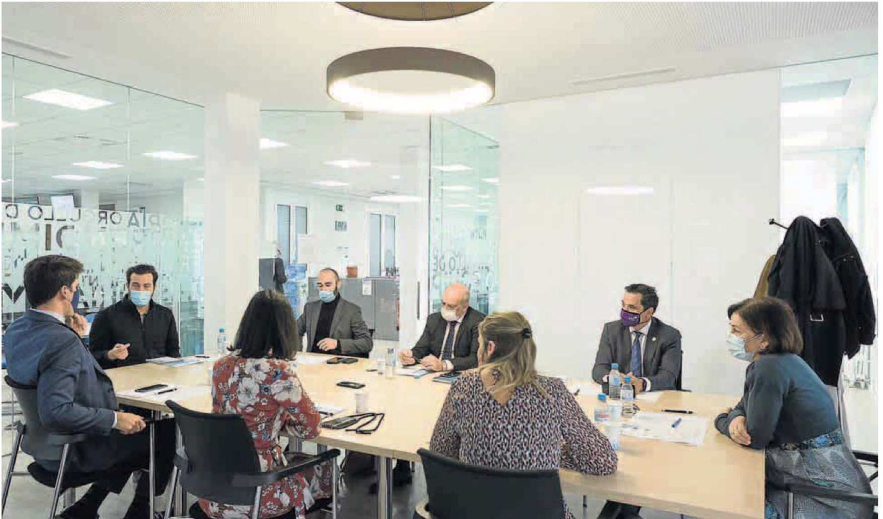
Los intervinientes durante un instante de la mesa debate celebrada en las instalaciones de HERALDO el pasado miércoles.

Representantes del Gobierno de Aragón, FCC Medio Ambiente, Fertinagro, Aquara-Grupo Agbar, Saica, Fundación Ibercaja y Grupo San Valero se reunieron el pasado miércoles en las instalaciones de HERALDO para debatir sobre la importancia de cumplir los Objetivos de Desarrollo Sostenible que marca la Agenda 2030 de la ONU y los retos que existen al respecto